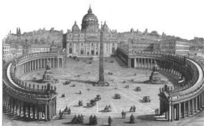
CHURCH OF ST. PETER, ROME.

Esta avenencia entre el paganismo y el cristianismo dio por resultado el desarrollo del "hombre de pecado" predicho en la profecía como oponiéndose a Dios y ensalzándose a sí mismo sobre Dios. Ese gigantesco sistema de falsa religión es obra maestra del poder de Satanás, un monumento de sus esfuerzos para sentarse él en el trono y reinar sobre la tierra según su voluntad. Satanás se había esforzado una vez por hacer transigir a Cristo. Vino a donde estaba el Hijo de Dios en el desierto para tentarle y mostrándole todos los reinos del mundo y su gloria, ofreció entregárselo todo con tal que reconociera la supremacía del príncipe de las tinieblas. Cristo reprendió al presuntuoso tentador y le obligó a marcharse. Pero al presentar las mismas tentaciones a los hombres, Satanás obtiene más éxito. A fin de asegurarse honores y ganancias mundanas, la iglesia fue inducida a buscar el favor y el apoyo de los grandes de la tierra, y habiendo rechazado de esa manera a Cristo, tuvo que someterse al representante de Satanás, el obispo de Roma.