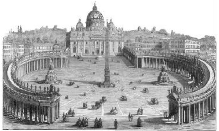
CHURCH OF ST. PETER, ROME

U NA de las principales doctrinas del romanismo enseña que el